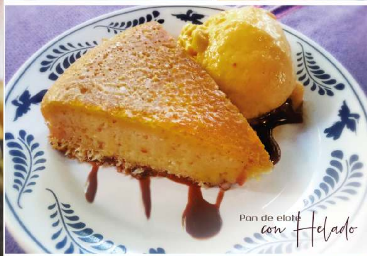
Pan de elote con Helado