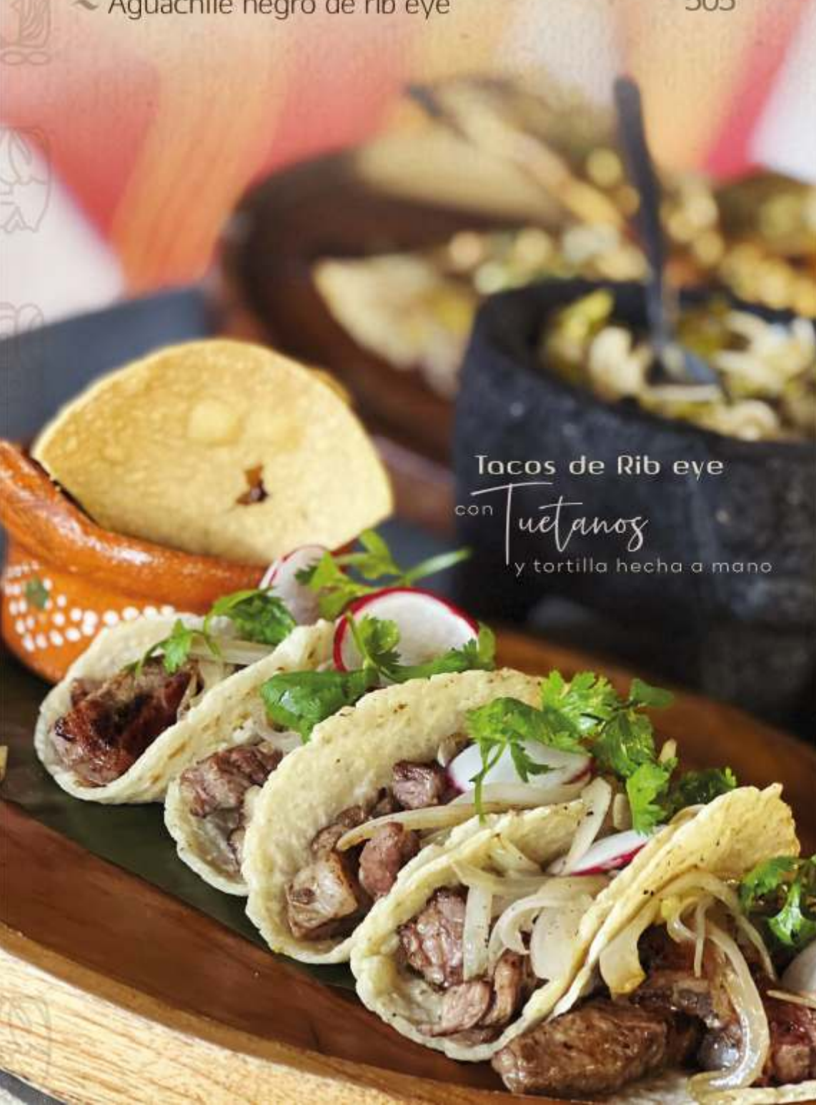
Tacos de Rib eye con Tuetanos y tortilla hecha a mano