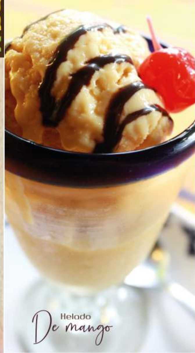
Helado De mango